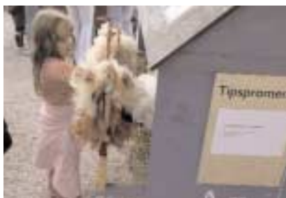
Unga och gamla deltog i tipspromenaden.

DRYGT 13 000 personer besökte Skansen när Kfs bjöd in till medlemsdag. Populäraste inslaget under dagen, åtminstone bland barnen, var Nicke och Nillas show. Tematräffen "Nytta och nöje av örter och gräs" drog också mycket folk. För alla fikasugna fanns Kfs kafé, som enbart serverade ekologiska produkter. Många deltog också i en tipspromenad med kluriga frågor om föreningen och Skansen och lärde sig mer om miljö på Ekostigen.