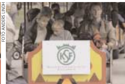
Här puffar Kfs-tåget runt Skansen.